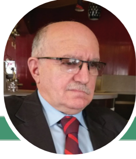
"أعطنا خبزنا كفاف يومنا"