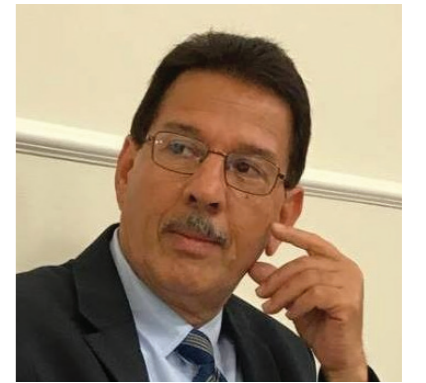
هايف بشوش- الدنمارك

الروائي الذي تجلّى واضحا في رواياته القصيرة جدا ومنها رواية المقايضة ، أرض الزعفران ، المجهول ، القداحة الحمراء ، وغيرها . وأعتقد انه سوف تتعرض الرواية القصيرة جدا الى الدحض والنقض والمواقفة أيضا فق الوقت ذاته لأن أي مبدع سواء كان حميد أو غيره سيبتعرض للنقد وعلى كافة أنواعه لأن النقد أول مبادئ شفهيا : على سبيل المثال حين يقرأ شخص شعرا معينا سوف نقول فوراً ( الله ) أو جميل وغيرها من معاني الإعجاب ثم تطور وجاء سقراط وبعده افلاطون وغيرهما ، وحتى القرآن الكريم استخدم النقد ضد الشعراء وفق الآية ( الشعراء يتبعهم الجرجاني ( إن عبت الناس عابوك وإن تركت الناس تركوك ) . في ذلك الوقت لم يكن للنقد اصول وقوانين حتى جاء القرن التاسع عشر وأصبح للنقد اصول ومعايير وجاءت المدارس العديدة ومنها الرمزية والرومانسية وغيرها وجاءت المصطلحات النقدية على سبيل المثال السيميوطيقي بالنسبة للناطقين باللغة الفرنسية والسيميولوجي للناطقين بالإنكليزية والسيميائي لشعوب الشرق ، ثم جاءت المدارس العديدة منها الأسلوبية والاسنوية والسوريالية والبنوية والتكعبية حتى وصلنا الى الحداثة بعد الحرب العالمية ثم ما بعد الحداثة ثم التجريب الذي وصلنا الى أربعين عاما من ظهوره في الغرب ، التجريب الذي من خلاله ظهر النص المفتوح الذي اكتشفه إمبرويكو ١٩٥٨ وهذا النص أطلق عليه الكثير من المصطلحات ، فلماذا