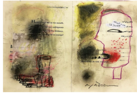
هي المشاهدة الأولى لشكل الجسد ومظهره الخارجي .