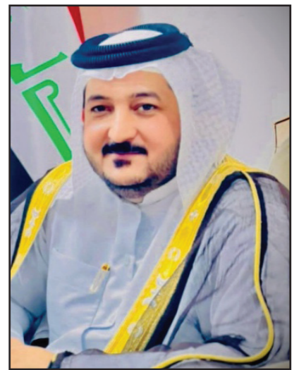
غزوان بن محمد الغزالي

الاجتماعية التي يقوم عليها الدستور العراقي، وهو الركيزة الأخلاقية التي يُبنى عليها الأمن المجتمعي والسلم الأهلي. فالاحترام فضيلة حميدة، ومبدأ إنساني سام يضمن بقاء النسيج الوطني متماسكاً رغم اختلاف الرؤى والتوجهات. وكما قيل: الاختلاف في الرأي لا يفسد للود قضية، أي إن اتساع رقعة الخلاف لا يعنى بالضرورة انقطاع لغة المحبة أو الحوار، بل يفتح المجال للتفكير في التفكير مع بقاء المودة قائمة بين أبناء الوطن الواحد. وفي هذا السياق، تبرز فئة من العراقيين لا تؤمن بجدوى العملية السياسية الحالية، وترى أن الإصلاح الحقيقي لا يمكن أن يتحقق عبر صناديق الاقتراع في ظل بقاء القوى والأحزاب نفسها التي أرهقت الدولة وبذّدت ثروات الشعب. هؤلاء يطالبون بتغيير جذري، لا شكلي، يضع حداً للفساد السياسي المستشري في مؤسسات الدولة، ويعيد للدولة هيبتها ومؤسساتها. ويُمثل هذا الاتجاه موقف السيد مقتدى الصدر (عزّه الله)، الذي لا يختلف اثنان على وطنيته وإخلاصه للعراق وشعبه، فهو رجل فذم الكثير وضحي بالغالي والنقيس من أجل استقرار الدولة العراقية وديمومتها. ولأنه الأدرى بخفايا المشهد السياسي وتشابكاته، فقد اختار