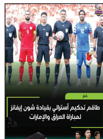
6 آلاف متفرج للجمهور العراقي في مباراة الذهاب". وأضاف "تخصيص 59 ألف مقعد لمشجعي المنتخب العراقي مقابل 5 آلاف مقعد لمشجعي المنتخب الإماراتي في مباراة الإياب التي ستقام على ملعب البصرة الدولي" في 18 تشرين الثاني الجاري، وأشار الفيفا إلى أنه "في حال تعادل المنتخبين في مباراة الذهاب بالإمارات، وتعادلهما

تاريخ مواجهات الإمارات ضد العراق في جميع المسابقات، وذلك قبل الصدام المرتقب بينهما على ملعب محمد بن زايد، اليوم الخميس 13 تشرين الثاني، بذهاب للملحق الآسيوي الختامي المؤهل للملحق