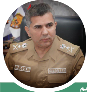
(( حديث الوفاء والاعتزاز ))