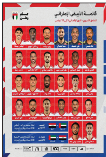
صعب وكلنا جاهزون لنقدم مباراة جيدة

أكد مدرب منتخب الإمارات كوزمين أولاريو، أن مواجهة العراق تمثل محطة مهمة في مشوار المنتخب الإماراتي ضمن الملحق الآسيوي المؤهل إلى نهائيات كأس العالم