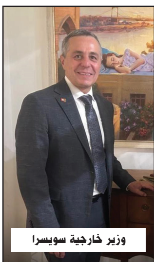
وزير خارجية سويسرا

بيّنت عبد المجيد أن البيت أنشئ العام 1917 بوصفه منزلًا عائليًا، أي أن عمره اليوم (108) أعوام، وهو ما يجعله أقدم من عمر كثير من الدول الحديثة. وقد حافظت العائلة على هذا الصرح رغم ما مر به البلد من حروب وصراعات وحصار، دون التفكير بالتفريط به.