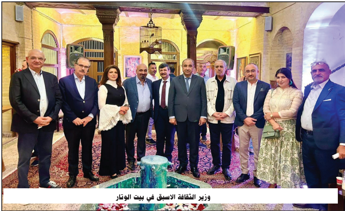
وزير الثقافة الاسبق في بيت الوتار