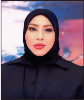
كواكب علي السراي

خدموا "فقط" أربع سنوات في كل دورة، ومع ذلك استحقوا رواتب تقاعدية كاملة، يصعب تبريرها بمنطق العدالة أو الإنصاف. وإذا نظرنا بعين الواقع، فإن الراتب التقاعدي للنائب الواحد يبلغ حوالي 8 ملايين دينار عراقي، بالإضافة إلى امتيازات خاصة خلال الدورة البرلمانية التي مدتها أربع سنوات، مثل: •الراتب الأساسي: 8 ملايين دينار عراقي. •بديل حماية /أمن: 16 مليون دينار عراقي. •بديل سكن: حوالي 3 ملايين دينار عراقي. •بديل سفر داخل العراق وخارجه: 600 دولار أمريكي لكل يوم سفر، ناهيك عن الامتيازات الأخرى. أما مجموع ما يُصرف شهرياً لهؤلاء المتقاعدين، فيصل إلى نحو 12 ملياًً و800 مليون دينار عراقي. أي أن ما يُصرف سنوياً لهم يزيد على 153 مليار دينار، مقابل خدمة قصيرة في موقع تشريعي، بينما تعاني