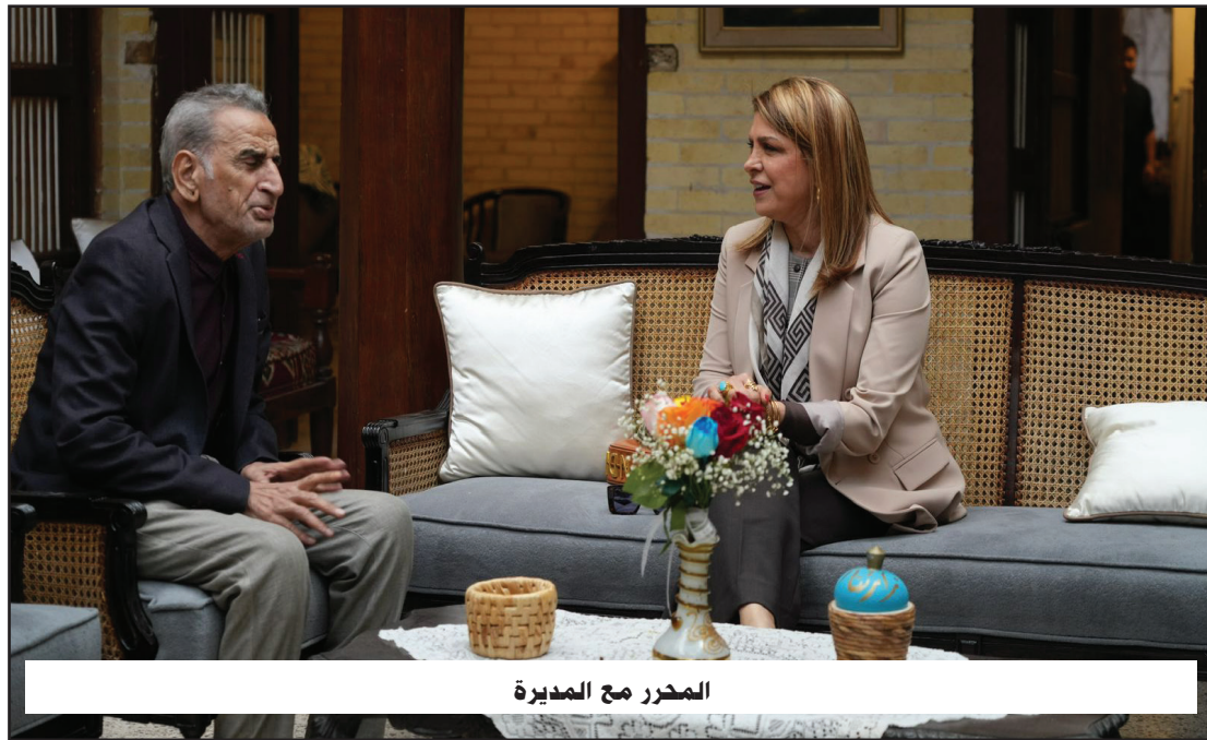
المحرر مع المديرة